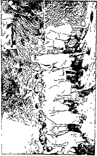
विनोबाजी पदयात्रा करते हुए